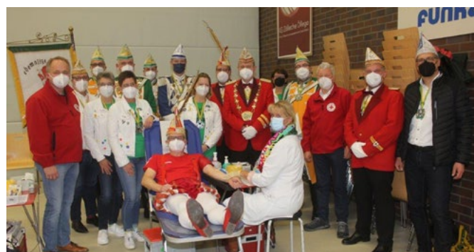
Prinzenblutspende in Zülpich: Beim närrischen Aderlass floss ordentlich Karnevalisten Blut

Die nächste Blutspende findet am 28. März von 15.30 Uhr bis 20 Uhr im Forum Zülpich statt. Termine können bereits unter www.blutspende.jetzt gebucht werden. FH