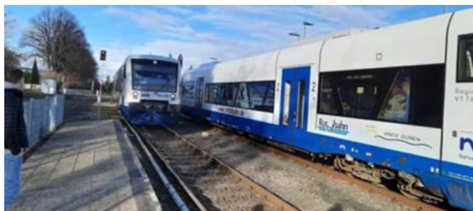
Zugkreuzung am Bahnhof Zülpich

Aufgrund von Softwareproblemen konnte der Studentakt auf der Strecke der Eifel-Bördebahn (RB 28) erst am 08.01.2023 starten und somit den am 11.12. eingerichteten Schienenersatzverkehr endgültig ablösen.