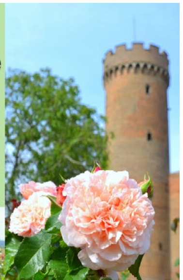
Die Rose von Zülpich "Rose de Tolbiac"